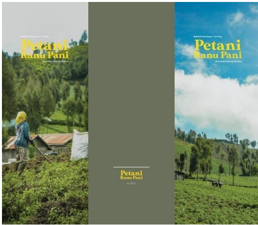
Gambar 7. Media Pendukung Bookmark Buku “Petani Ranu Pani”