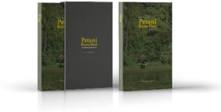
Gambar 6. Media Pendukung Booksleeve Buku