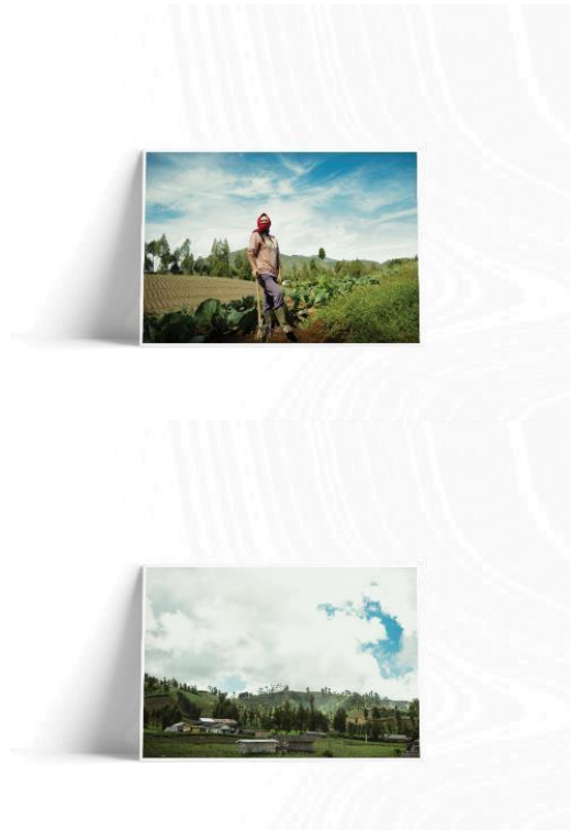
Gambar 8. Media Pendukung Poster Buku “Petani Ranu Pani”