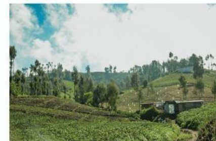
Comprehensive Layout Buku “Petani Ranu Pani”

Berikut merupakan contoh comprehensive layout dari perancangan ini: