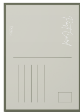
Gambar 9. Media Pendukung Postcard Buku “Petani Ranu Pani”