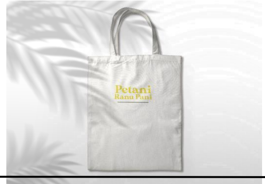
Gambar 10. Media Pendukung Tote Bag Buku “