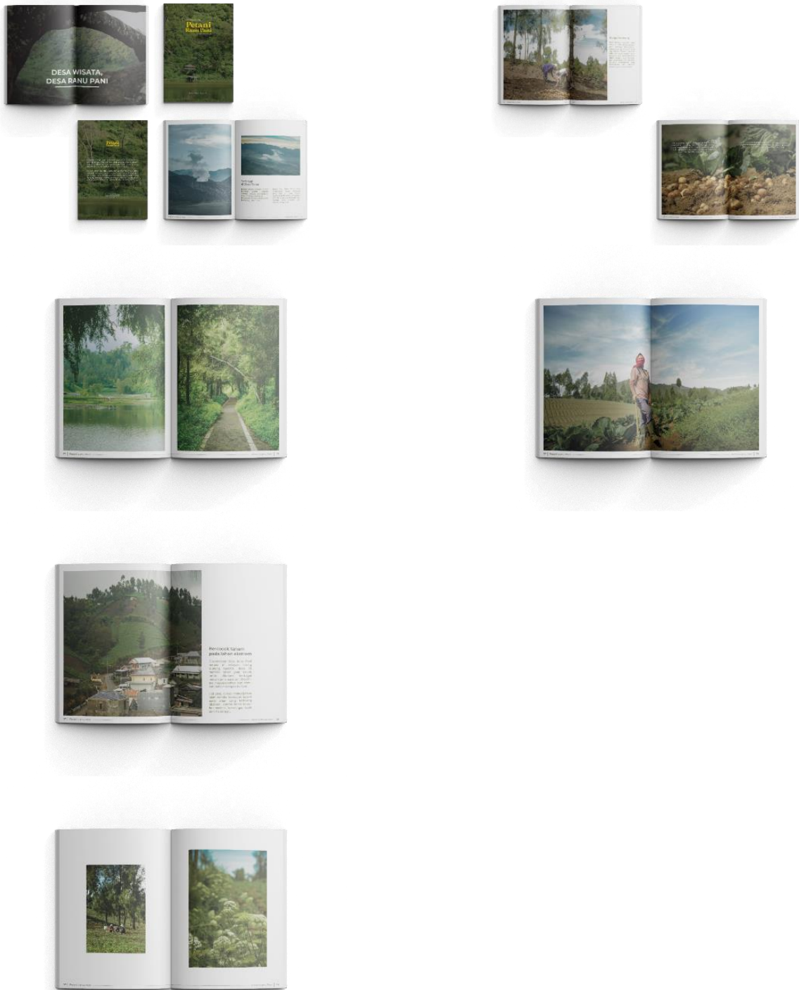
Gambar 5. Final Design Buku “Petani Ranu Pani”