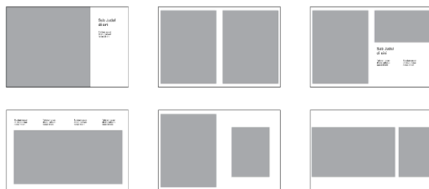
Gambar 2. Rough Layout Buku “Petani Ranu Pani”

Setelah thumbnail layout dirasa sudah cukup, maka akan dilanjutkan dengan memilih beberapa opsi layout untuk dijadikan rough layout yang menggunakan Adobe Illustrator pada kanvas berukuran 22 x 32 cm secara landscape .