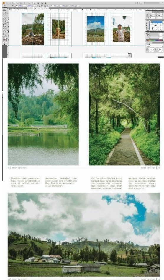
Gambar 4. Comprehensive Layout Buku “Petani Ranu Pani”